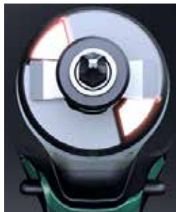
Visseuse conventionnelle 2 butées = 2 points de frappe