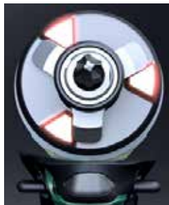
Visseuse Triple HAMMER 3 butées = 3 points de frappe = PLUS de performance