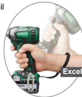
Excellente prise en main